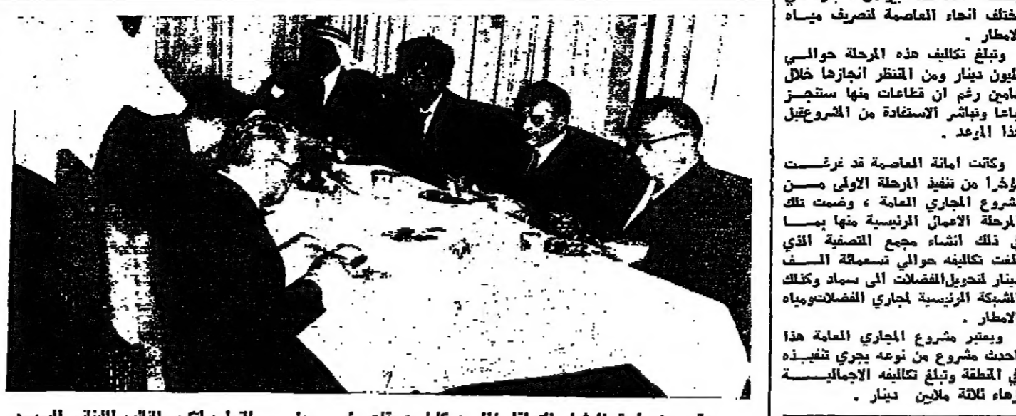
جانب من مائدة العشاء التي أقامها السيد كامل عريفات رئيس مجلس أوقاف تكريم القائل اللبناني السيد جمال جنبلاط رئيس الحزب التقدمي الاشتراكي

عمّان - أعلن المهندس احمد فوزي أمين العاصمة عن طرح عطاء المرحلة الثانية لمشروع المجاري العامة لعاصمة عمّان. وذكر المهندس فوزي أن هذه المرحلة تتضمن تنفيذ ما طوله حوالي ١٢ كيلومترا من انابيب الشبكة الفرعية التي تصل بالمجاري القاطن ومختلف انشاء عدد كبير من المزارع في مختلف أنحاء العاصمة لتصرف مياه